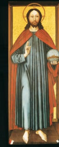
Christus als Salvator Mundi Augsburgisch, 1494

Der „Rittersaal“ mit seiner prachtvoll geschnitzten Kassettendecke, den Reliefs der Muttergottes und der Bistums-Heiligen Ulrich, Afra und Simpert sowie den seltenen Glasgemälden von Hans Holbein d. Ä. und Hans Burgkmair lässt die kulturelle Blüte zur Zeit Kaiser Maximilians I. aufleben. Dagegen ziehen eindringliche Darstellungen von Pest und Krieg, Geißeln der Menschheit, den Betrachter in die historische Wirklichkeit der frühen Neuzeit.