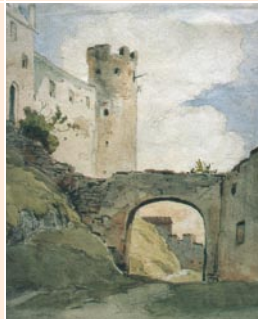
Franz Graf von Pocci, Aufgang zum Hohen Schloss, Aquarell, 1842

Mit dem Monumentalgemälde „Prozession in Leukerbad“ von Oskar Freiwirth-Lützw (1862–1925) wird ein Hauptwerk dieses Künstlers, der im Stil des „Bürgerlichen Realismus“ malte, gezeigt. Geboren in Moskau, wuchs er in St. Petersburg auf, studierte in Genf, Düsseldorf, Paris und München. Seit 1914 bis zu seinem Tod 1925 lebte er in Bad Faulenbach.