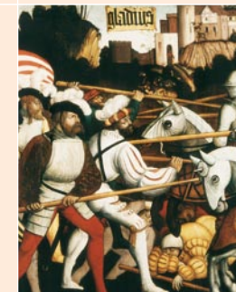
„gladius“ – Der Krieg Oberschwäbisch, um 1500.