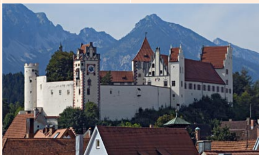
Hohes Schloss Füssen

Nachdem Füssen zwischen 1274 und 1286 das Stadtrecht verliehen wurde, begann 1291 der bayerische Herzog Ludwig der Strenge widerrechtlich mit dem Bau einer Burg. Der Augsburger Bischof erwirkte die Einstellung der Bauarbeiten, erwarb 1322 den Schlossberg