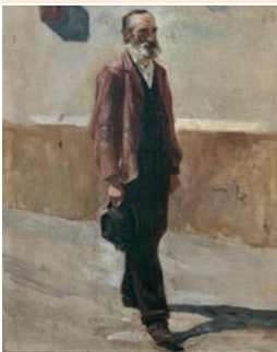
Oskar Freiwirth-Lützw, Studie zu „Prozession in Leukerbad“, um 1890