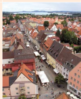
Blick aus dem Uhrturm

Einerseits kann man bei der Turmbesteigung die schönsten Aussichten genießen, andererseits aber auch Einblicke in die Lebensweise eines Türmers erfahren.