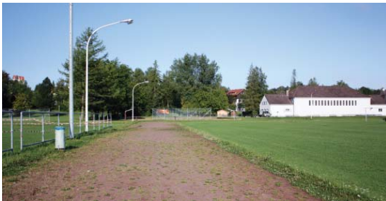
Schon lange nicht mehr in gutem Zustand: die alte Laufbahn.