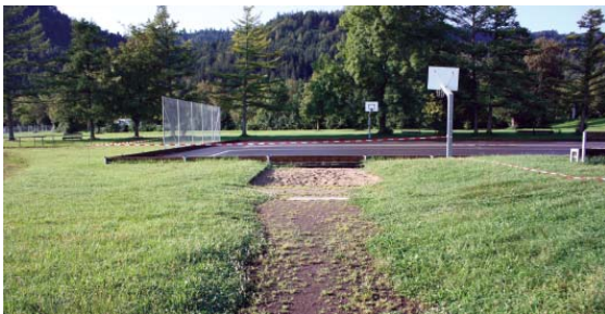
Schon fast komplett zugewachsen: die alte Weitsprunganlage.