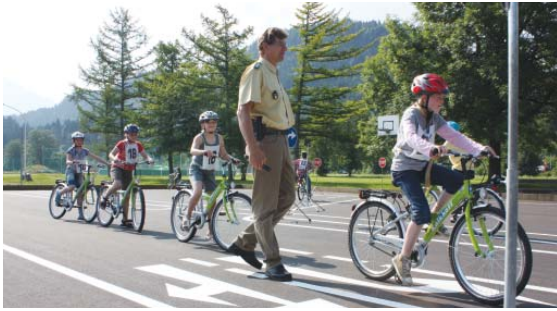
Auch für die Verkehrserziehung der Grundschülerinnen und Grundschüler bietet der neue Allwetterplatz jetzt beste Voraussetzungen.