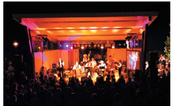
Bei der Kubanischen Nacht in Hopfen am See erstrahlte der neue Musikpavillon in allen Farben.

Erstrahlt nun in neuem Glanz: der Musikpavillon an der Uferpromenade am Hopfensee. Vereine und die Stadt Füssen haben diesen Neubau gemeinsam realisiert.