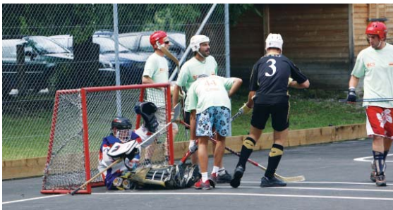
Füssener Sporttage 2009: Beim Fieseln freuten sich alle Teilnehmer über den neu sanierten Allwetterplatz.