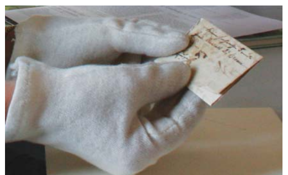
Bei Archivarin Ruth Michelbach in guten Händen: der Brief aus der Hand von König Ludwig I. wird im Stadtarchiv Füssen fachgerecht aufbewahrt.

Da der Brief auf Holzschliffpapier verfasst wurde, das sich aufgrund der enthaltenen Lignin-Säure im Laufe der Zeit unter Lichteinfluss zersetzt, ist es nicht möglich, das Fundstück im Museum auszustellen. Um das fragile Schriftstück auch für die Zukunft zu erhalten, wurde eine besondere Konservierungsform gewählt. Auf säurefreier Pappe, abgedeckt mit säurefreiem Seidenpapier, wird das