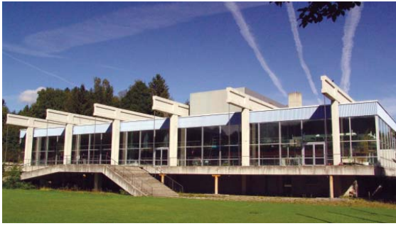
Schon lange nur noch eine Bauruine, das 1972 fertiggestellte Hallenbad der Stadt Füssen. Schon im nächsten Jahr werden hier die Bauarbeiten an der neuen Wohnanlage unter dem Thema „Wohnen im Park“ beginnen.

Füssen. Am ersten Juli 2005 wurde der Betrieb im Hallenbad der Stadt Füssen eingestellt. Lange hat man nach Möglichkeiten gesucht, das in die Jahre gekommene Gebäude zu veräußern. Jedoch ohne Erfolg. Jetzt ist es endlich gelungen. Ein Investor hat das Grundstück am Galgenbichl gekauft und schon bald wird hier unter dem Thema „Wohnen im Park“ eine hochwertige Wohnanlage entstehen.