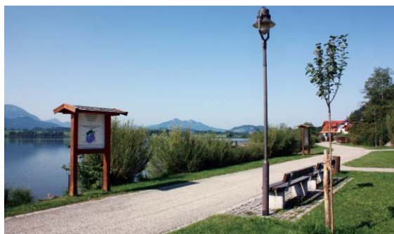
Schon im nächsten Herbst werden die neuen Obstbäume an der Hopfener Uferpromenade die ersten Früchte tragen.

Hopfen am See. „Qualität hat keine Endstufe. Die Stadt Füssen und natürlich alle dazugehörigen Stadtteile müssen immer attraktiv gehalten werden, denn nur so kann der Tourismus in Füssen gestärkt und auf Dauer ausgebaut