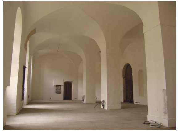
Präsentiert sich nun bald wieder in ursprünglichem Zustand: Die Klosterküche des ehemaligen Klosters St. Mang.

Betritt man heute die ehemalige Klosterküche der Abtei St. Mang,