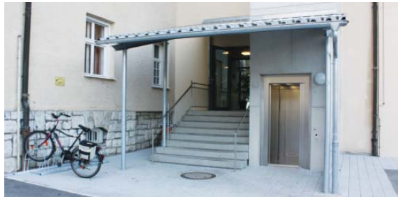
Durch den neuen Fahrstuhl am Hintereingang (Bild oben) und die Rampe am Haupteingang (Bild unten) ist das Gesundheitszentrum im alten Landratsamt nun vollkommen barrierefrei.