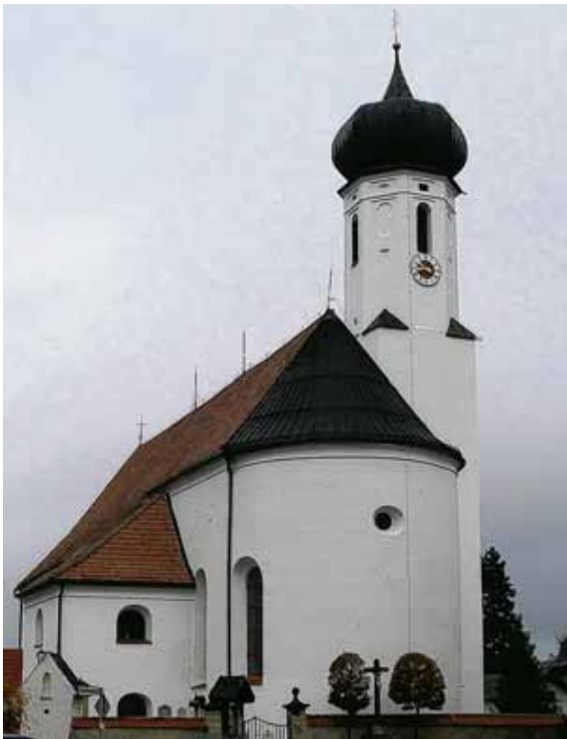
Die Kosten für die Sanierung der Kirche in Bayerniederhofen sorgten im Gemeinderat Halblech für Diskussionen.