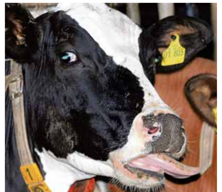
Eine von der Blauzungenkrankheit betroffene Kuh – das Bild wurde 2006 in Nordrhein-Westfalen aufgenommen, wo die Tierseuche in Deutschland zuerst auftauchte.